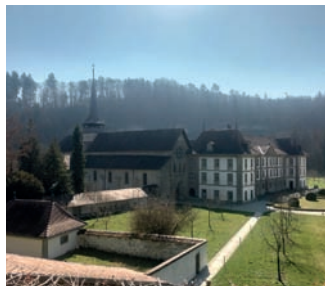
Abbaye Hauterive près de la Sarine

En étant bien équipé (chaussures, imperméable) de Grangeneuve FR à l'abbaye d'Hauterive (courte visite possible de l'église rénovée récemment) en suivant la Sarine et la Gérine jusqu'à Tinterin FR