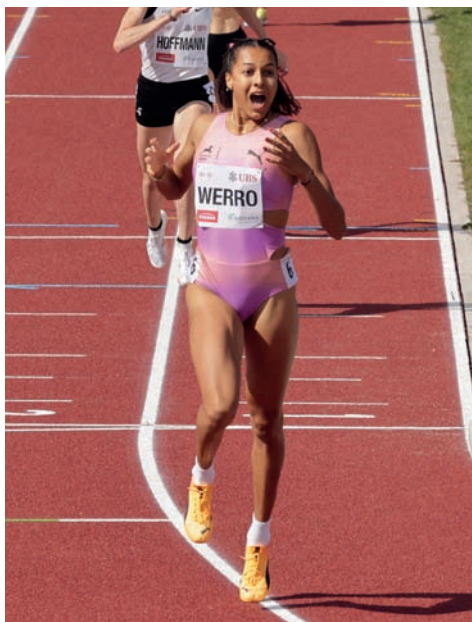
Victoire et record Suisse aux Championnats Suisses de Frauenfeld 2025

Simon: Dans quelle discipline technique serais-tu la meilleure? Plutôt les disciplines de saut ou de lancer?