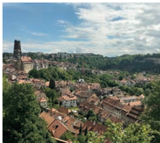
Ville de Fribourg