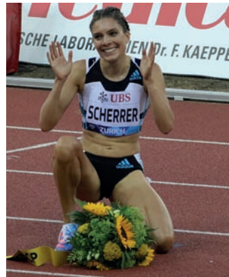
Chiara beim Diamond League Final in Zürich

Einen Nüsslisalat mit Ei, ein Safranrisotto von meiner Mutter (mit unserem eigenen Olivenöl aus der Toscana zubereitet) und italienische Profiteroles zum Dessert.