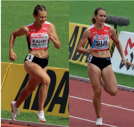
als Einzelkämpferin ... und Staffelläuferin