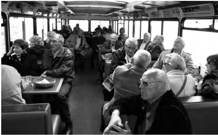
Kurzweilige Rundfahrt auf dem Vierwaldstättersee