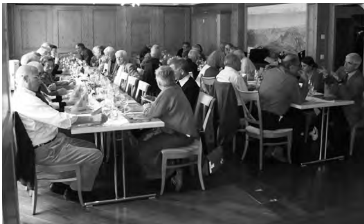
Feines Essen und interessante Gespräche im Saal des «Weissen Rössli»