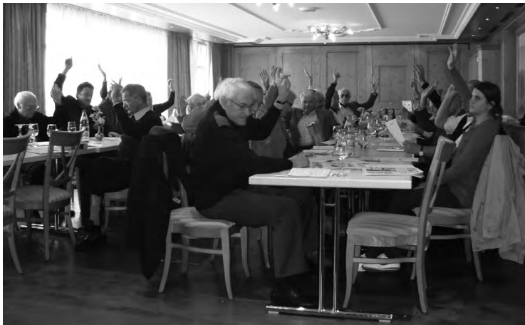
Der offizielle Teil ging in Rekordzeit über die Bühne