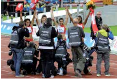
4 x 100m Staffel der Frauen, Weltklasse