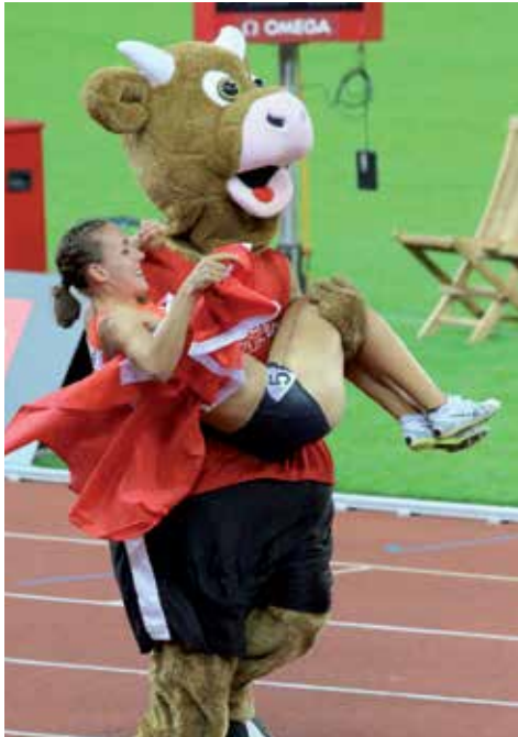
Selina Büchel, Hallen-Europameisterin 800m