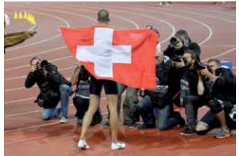
Kariem Hussein im Rampenlicht